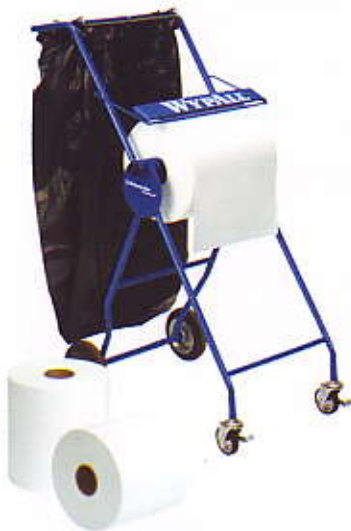
WYALL* L20 Perforated Jumbo Roll Wipers กระดาษเช็ดน้ำ